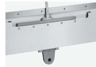
ALtop140中央驱动连接和中间支撑