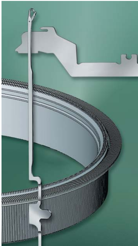
LA SINGULAR GAMA DE PRODUCTOS DE GROZ-BECKERT.