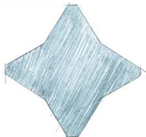
CAMPO DI LAVORO A QUATTRO SPIGOLI CROSS STAR®

La sezione del campo di lavoro assomiglia ad una stella equilatera a quattro spigoli con angoli di 60°. La disposizione delle barbe su tutti e quattro gli spigoli consente di ottenere caratteristiche ottimali dell'agugliato.