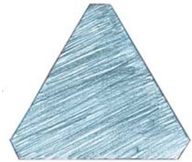
ZONA DE TRABALHO STANDARD EM FORMA DE TRIÂNGULO