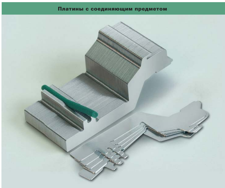
Платины с соединяющим предметом

Он держит надёжно платины вместе и способствует их простому выниманию. Гроц-Беккерт предъявил эту разработку на патентирование.