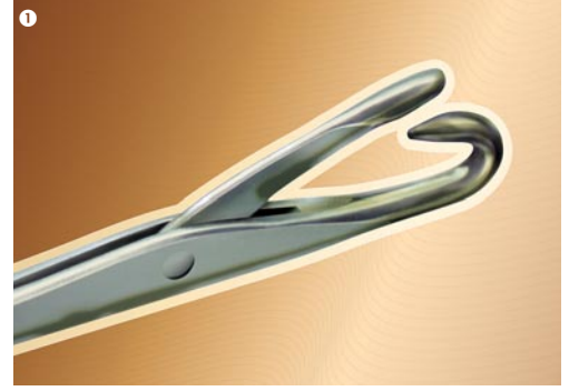
KOROZYONA KARŞI KORUYUCU YAĞIN OLUŞTURDUĞU KORUYUCU TABAKA