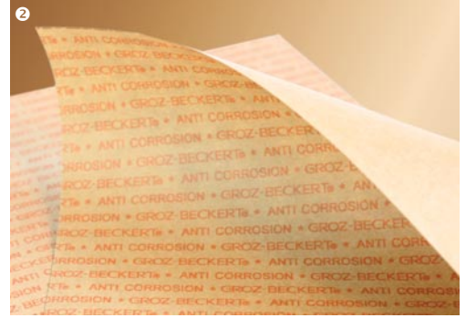
KOROZYONA KARŞI KORUYUCU KAĞIT