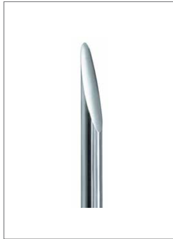
Kantenverrundungen und Oberflächengüte