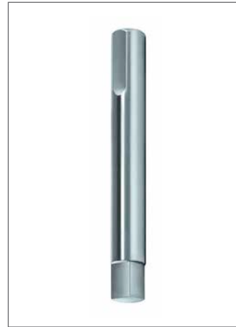
Hohe Form- und Lagegenauigkeit