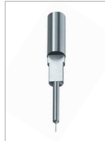
Ausrichtflächen für Formteile