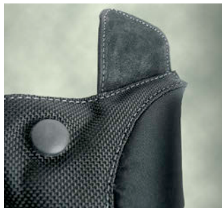
Courroies de transport