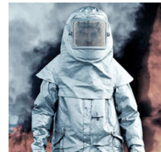
Roupas de proteção