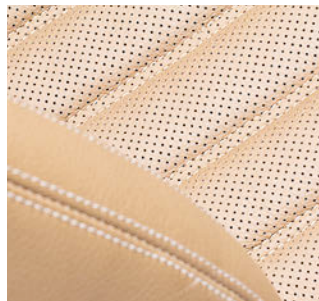
Bancos de automóvel