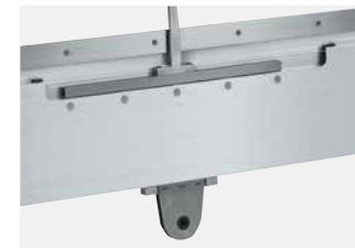
ALtop140中央驱动连接和中间支撑